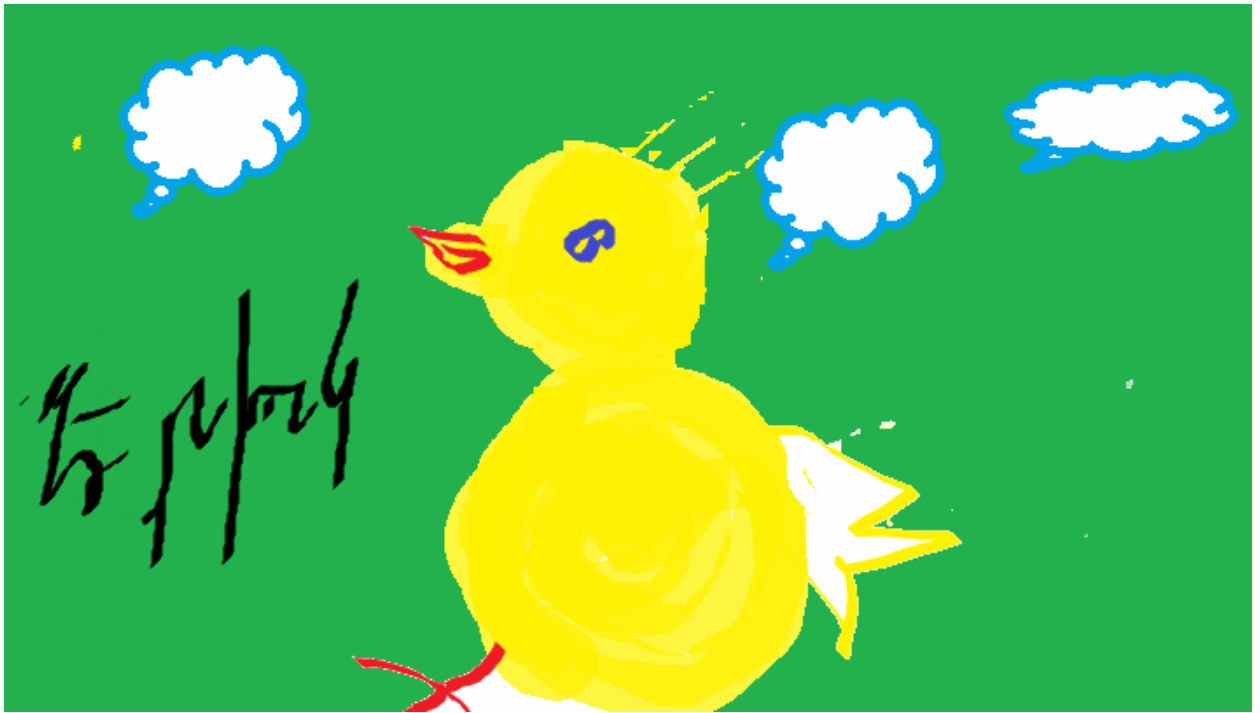
Էրիկ Հովհաննիսյան Գեղարվեստի դպրոց-պարտեզ, 3-րդ դասարան